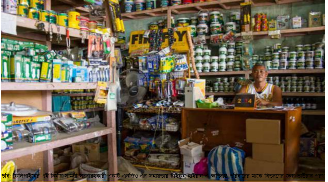
ছবি: ফিলিপাইনের এই নির্মাণ সামগ্রী সরবরাহকারী একটি এনজিও এর সহায়তায় টাইফুন হাইয়ান এ ক্ষতিগ্রস্ত পরিবারের মাঝে বিতরণের জন্য ভাউচার পূরণ করছে।

এই ধাপটি পরামর্শ প্রদানের মত, এবং এতে কত সময় লাগবে তা নির্ধারণ করা বেশ কঠিন। যাই হোক, যদি ব্যবস্থাপনা দলের সদস্যগণ বাজার বিশ্লেষণ এবং বাজার ভিত্তিক প্রোগ্রামিং এর সাথে পূর্বেই পরিচিত থাকেন তবে পিসিএমএ এর মূল উদ্দেশ্য সম্পর্কে তাদের বোঝাতে কম সময় নিবে। খুব সম্ভব এক বা দুই-চার ঘণ্টার মিটিং দ্বারাই তা সম্ভব হয়।